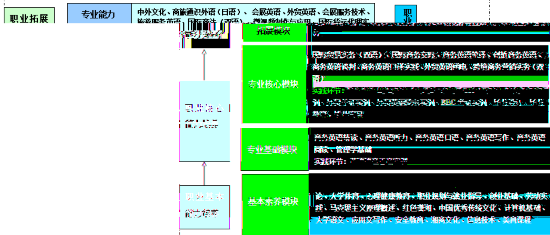
商务英语专业课程体系